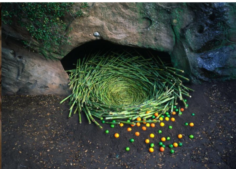
Nils Udo / faire œuvre en composant de façon éphémère et poétique les éléments naturels