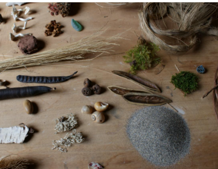
Véritable collection de graines de ZAZAGRANA

Intervenante : Isabelle Bach / tarif proposé : 200€